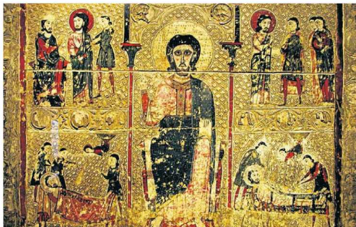
El frontal de Tresserra, una de les 111 obres que el bisbat de Barbaste-Montsó reclama ara a Catalunya als tribunals civils. Està datat de la segona meitat del segle XIII.

Les reclamacions de Berbegal i Peralta de Alcofea, igualment amb el vistiplau vaticà, també es remunten a la segregació de les parròquies del bisbat de Lleida en territori aragonès del 1995. El 2010 la justícia civil va denegar al bisbe Joan Piris l'auxili judicial que havia demanat per poder retornar a l'Aragó els béns de la Franja i l'any següent no va admetre a tràmit la denúncia que li havien posat Peralta de Alcofea i Berbegal per un presumpte delicte d'apropiació indeguda.