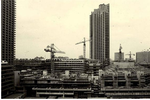
Chamberlin ,Powell and Bon