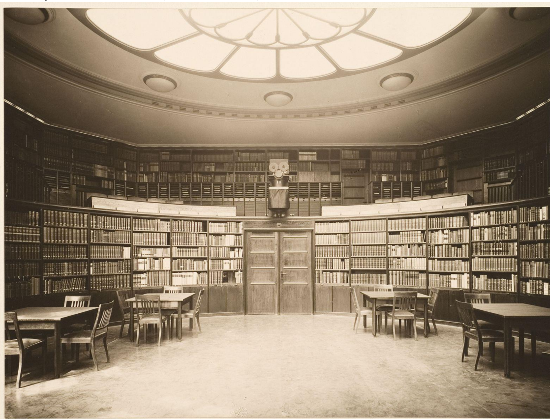
Sala de lectura de la biblioteca d'Aby Warburg a Hamburg (ca. 1926-1929).

Tanmateix, es privilegiarà el seu caràcter de "construcció cultural", ja que també elles són una forma de pensament profundament vinculada no solament amb la història del moment sinó també amb el món contemporani de la filosofia, de la literatura, de la teoria estètica